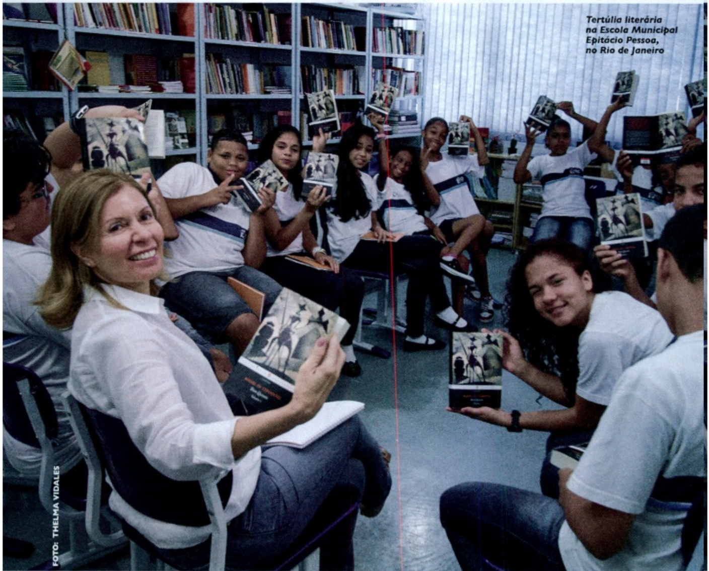
Tertúlia literária na Escola Municipal Epitácio Pessoa, no Rio de Janeiro