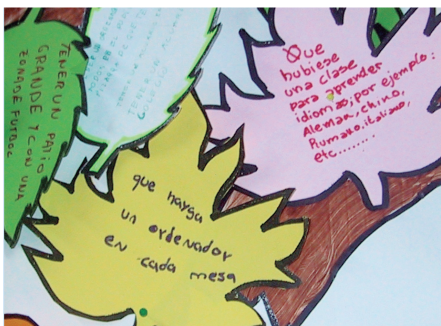
© CREA. Community of Research on Excellence for All

Los sueños suelen ser muy diversos, aunque en este proceso se toma conciencia de que, en realidad, los diferentes grupos y agentes que conforman la comunidad educativa tienen un sueño común y esencial: todos y todas quieren la mejor educación para los niños y niñas. Muchas veces, este proceso de sueño ayuda a superar resistencias y barreras entre el profesorado y las familias que, por primera vez, toman conciencia de que ambas partes trabajan con una misma finalidad. A menudo, aunque con diferentes lenguajes y formas de expresarlos, los sueños son muy parecidos. Por ejemplo, las maestras sueñan con una mejor convivencia y el alumnado con que haya menos peleas, pero están soñando lo mismo.