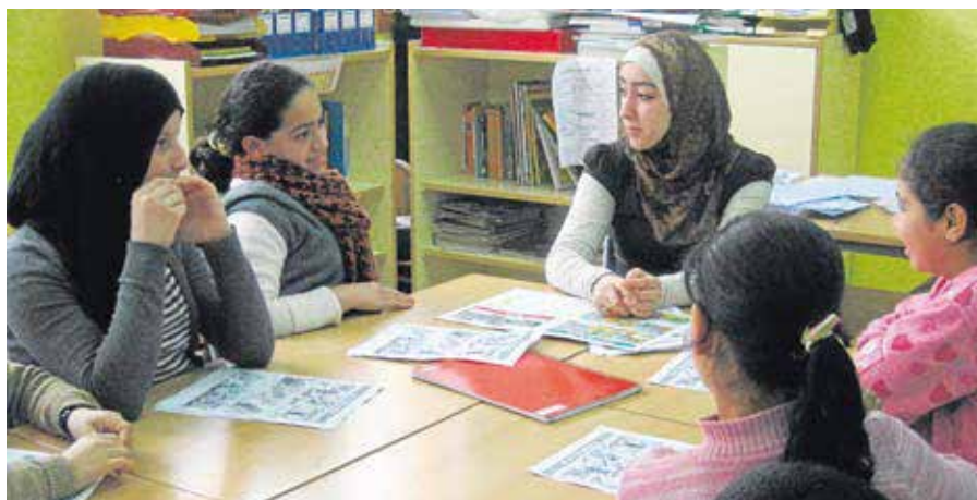
Escola Mare de Déu de Montserrat (Terrasa)

SANDRA GIRBÊS PECO/EQUIPE DE COMUNIDADES DE APRENDIZAGEM CREA-UB