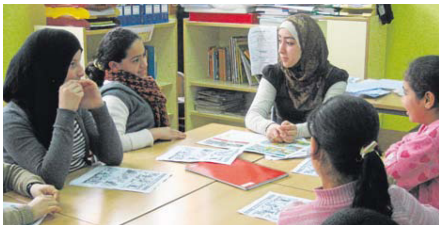
Escola Mare de Déu de Montserrat (Terrasa)

SANDRA GIRBÊS PECO/EQUIPE DE COMUNIDADES DE APRENDIZAGEM CREA-UB